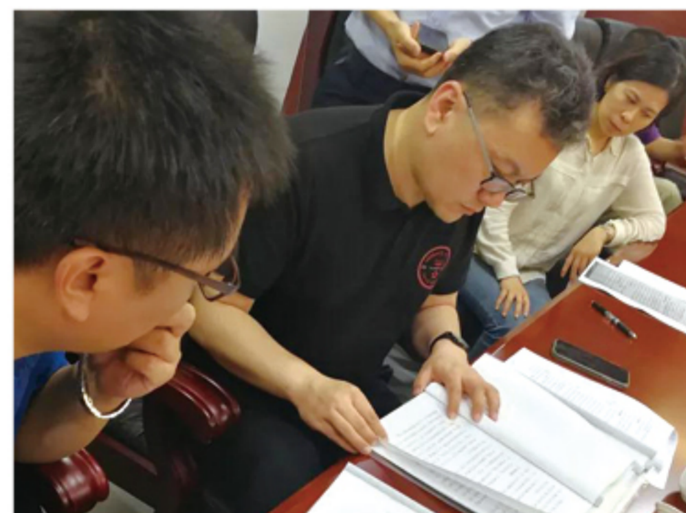
国务院第六次大督查第八督查组在查阅相关文件信息（9月6日摄）

“只有确认线上支付成功，才能在APP中开始学习，完成时长。每月学习时长必须不低于2小时，每小时12元。”举报此事的货车司机说：司机