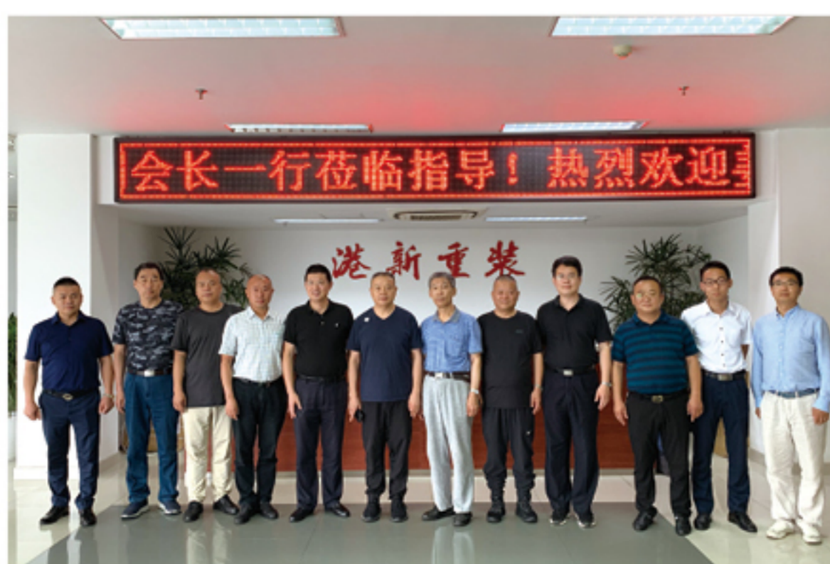
走访张家港港新重装码头港务有限公司