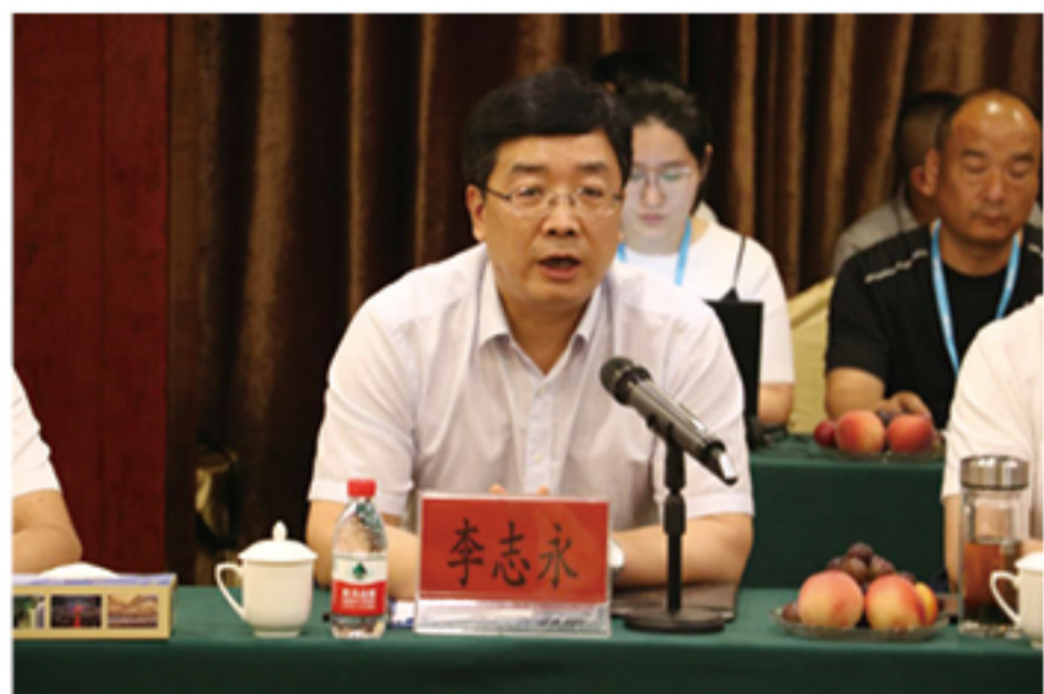
保定市徐水区李志永区长讲话