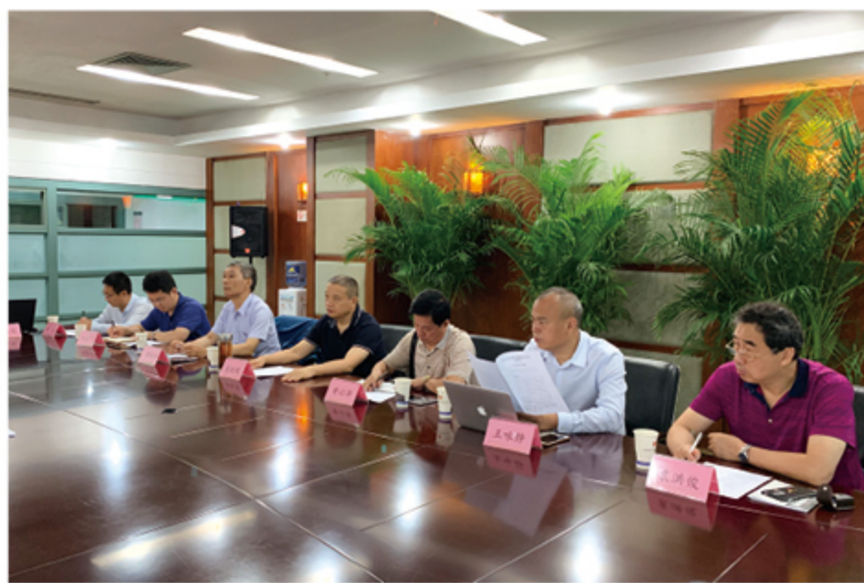
走访四川省政务服务中心