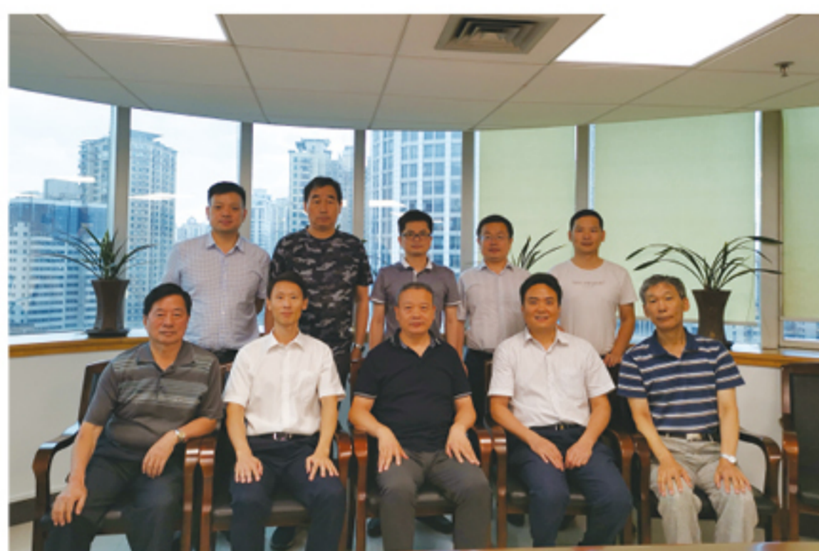
走访广东省交通厅