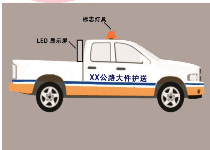
图 B.2 专业护送车辆（皮卡车）侧视图

以皮卡车为示例，标识自行护送车辆车身颜色、车身文字、标志灯具安装位置、LED 显示屏安装位置侧视示意图。