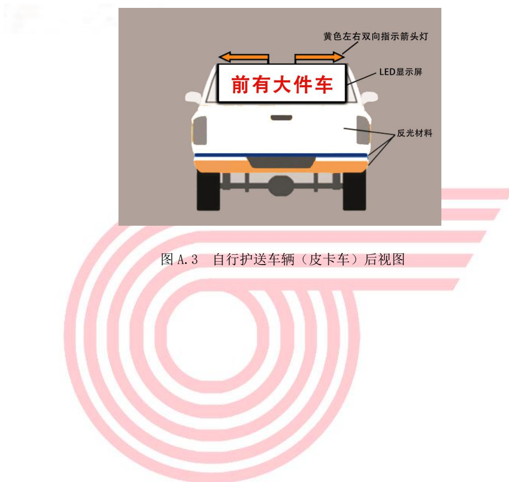
图 A.3 自行护送车辆（皮卡车）后视图

以皮卡车为示例，标识自行护送车辆车身颜色、标志灯具形状及安装位置、LED 显示屏大小及安装位置、车体喷涂反光标志后视示意图。