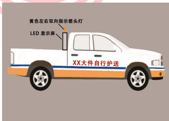
图 A.2 自行护送车辆（皮卡车）侧视图

以皮卡车为例，标识自行护送车辆车身颜色、车身文字、标志灯具安装位置、LED 显示屏安装位置侧视示意图。