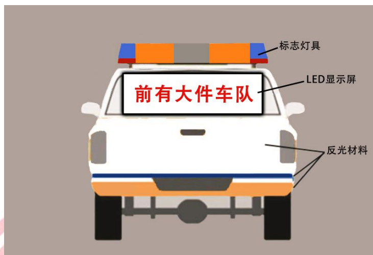
图 B.3 专业护送车辆（皮卡车）后视图

以皮卡车为示例，标识专业护送车辆车身颜色、标志灯具形状及安装位置、LED 显示屏大小及安装位置、车体喷涂反光标志后视示意图。