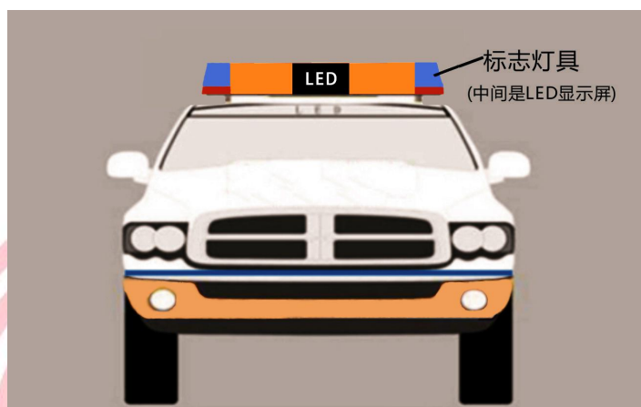
图 B.1 专业护送车辆（皮卡车）正视图

以皮卡车为示例，标识专业护送车辆车身颜色、车顶标志灯具颜色及安装位置、车顶 LED 显示屏安装位置正视示意图。